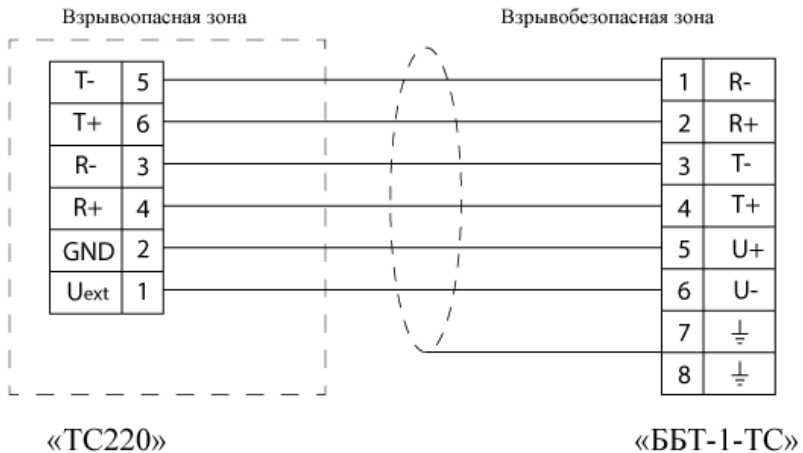
Рисунок 3. Схема подключения блока к корректору «ТС220».